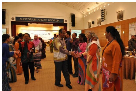
Para peserta sedang bersalaman dengan tetamu terhormat semasa majlis penutupan kursus