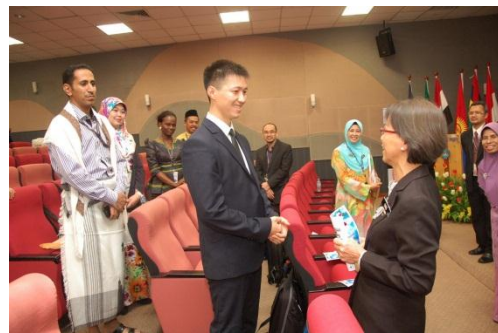
Peserta luar Negara diperkenalkan kepada Pengarah Sektor Audit Badan Berkanun