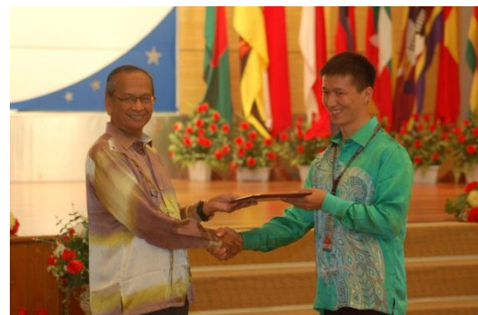
Peserta dari SAI Krgystan menerima sijil kursus dari Ketua Audit Negara