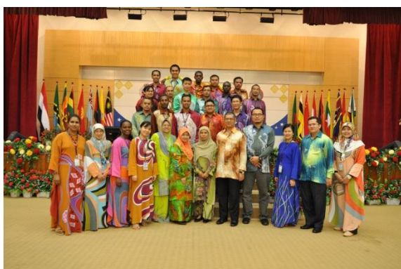
Gambar kumpulan peserta kursus dengan penceramah